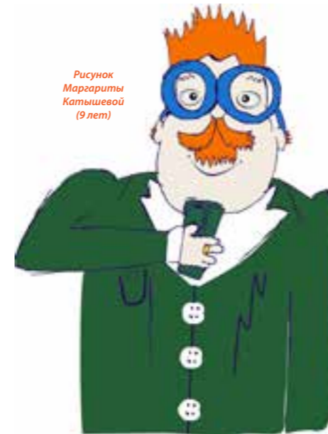
Инспектор Ди по заботе о клиентах. Магистр страхования

Можно ли застраховать транспортное средство по ОСАГО и КАСКО в разных компаниях?