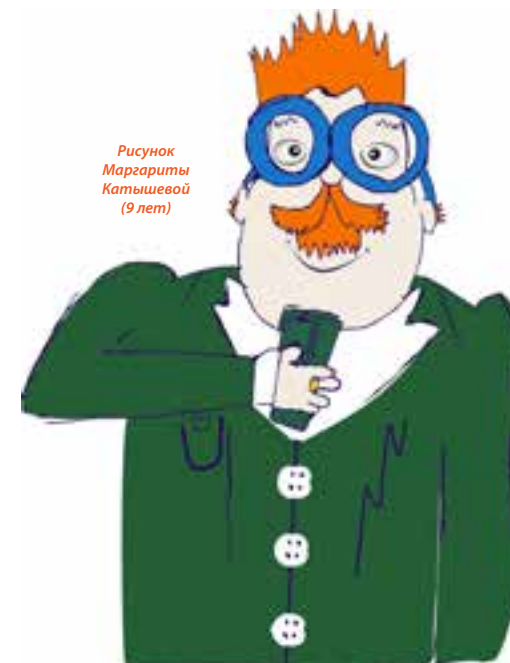
Рисунок Маргариты Катышевой (9 лет)

На вопросы читателей отвечает инспектор Ди